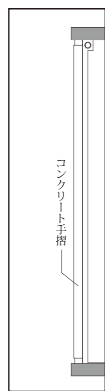
3～4階バルコニー平面図