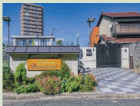
私立エンゼルキッズ名塚 徒歩4分(現地より約290m)