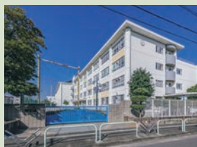
市立庄内小学校 徒歩8分(現地より正門へ約620m)