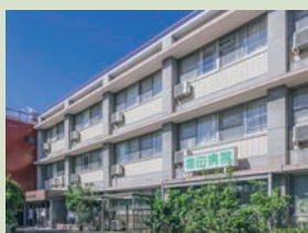
堀田病院[内科、皮膚科、循環器内科、胃腸内科、 呼吸器内科、放射線科] 徒歩3分(現地より約220m)

ご家族の「もしも」の為に、 大病院も生活圏内。 名古屋市立大学医学部 附属西部医療センター 徒歩19分(現地より約1,460m) ・総合病院 一般病床 500床 ・地域周産期母子医療センター ・「赤ちゃんにやさしい病院」認定 ・名古屋陽子線治療センター