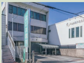
まじま医院[内科、呼吸器科、アレルギー科、小児科] 徒歩3分(現地より約240m)