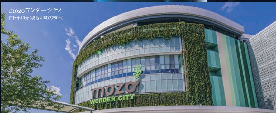
mozoワンダーシティ 自転車10分(現地より約2,890m)

休日は少し足を延ばしてシネマコンプレックスを有する「mozoワンダーシティ」や、ショッピングプラザの楽しみが広がる エンターテインメントモール「イオンモール Nagoya Noritake Garden」へ。 市内の各所へ、自転車でのアクセスも便利なポジションです。