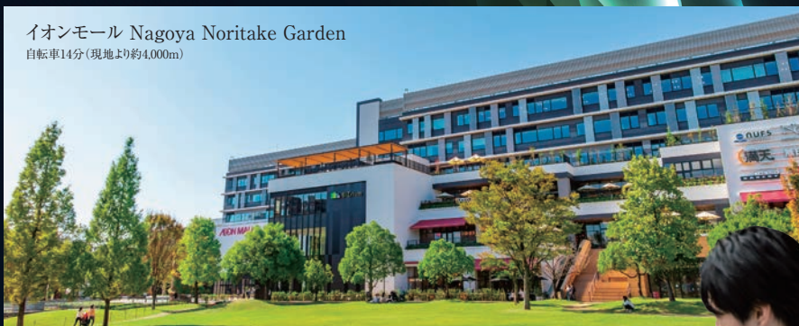
イオンモール Nagoya Noritake Garden 自転車14分(現地より約4,000m)