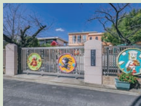
私立国風第二幼稚園 徒歩5分(現地より約380m)