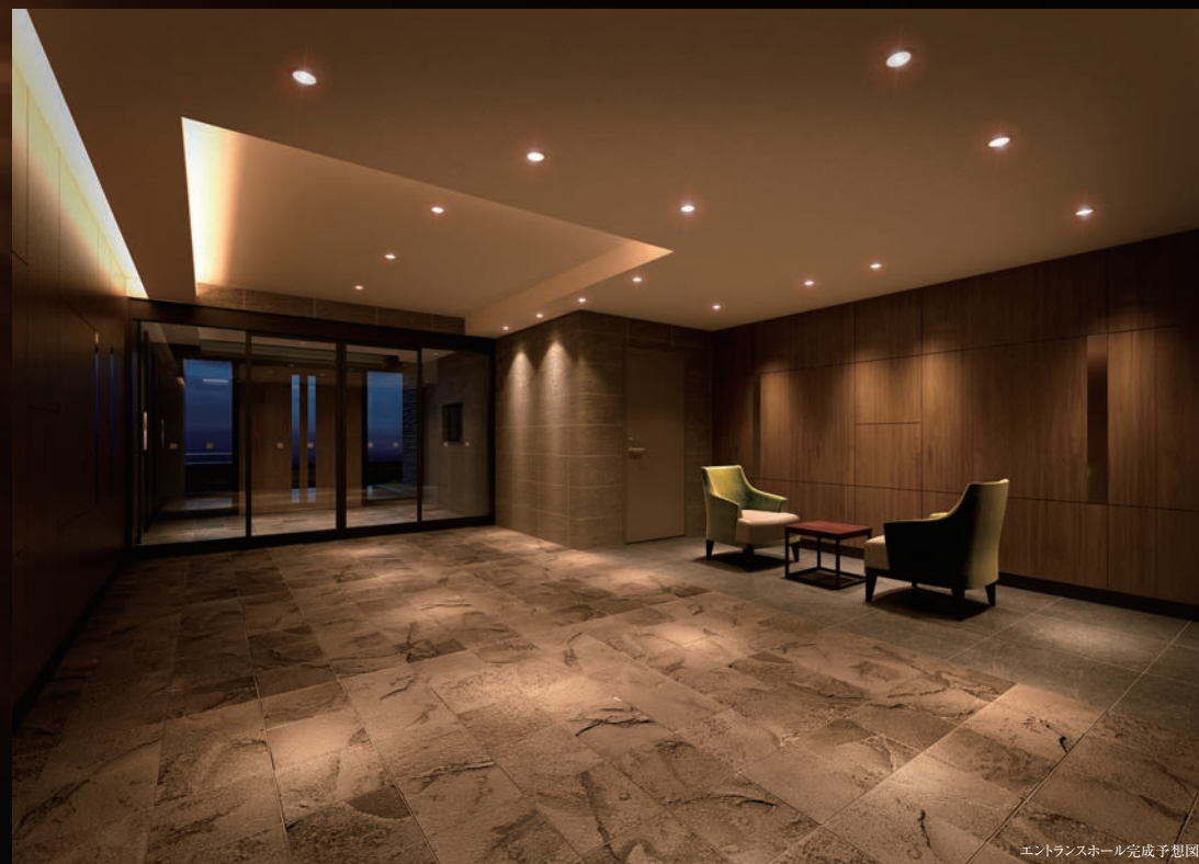
エントランスホール完成予想図

ボーダータイルや大判タイル、アルミルーバーなど風合いの異なる「ブラック」を組み合わせることで、深みのある表情を生み出しています。