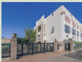
市立名塚中学校 徒歩11分(現地より東門へ約820m)